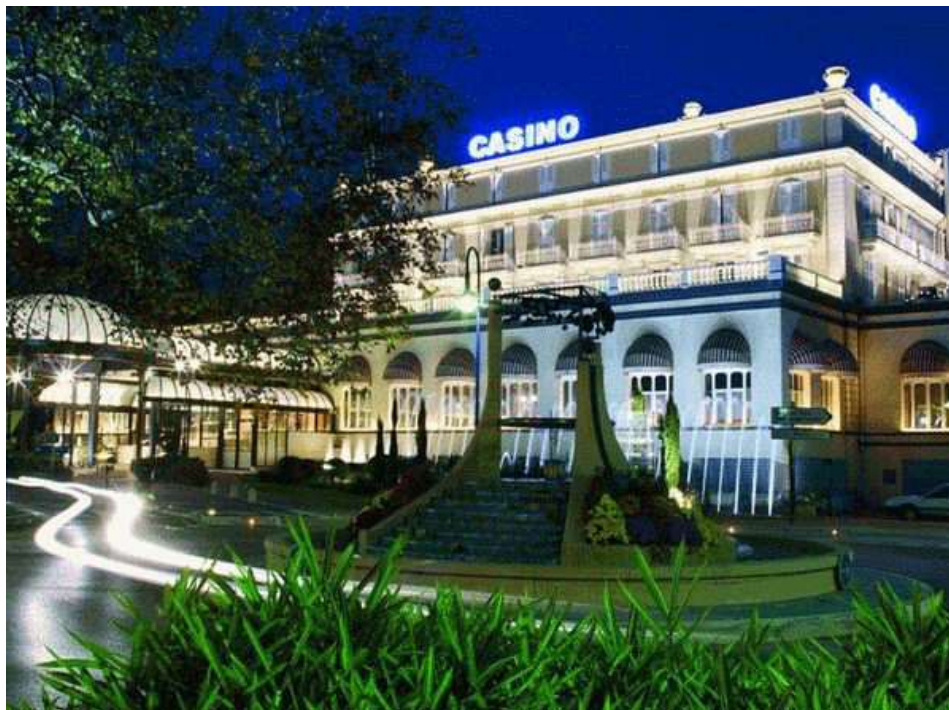
Le Casino très fréquenté, de la ville de Divonne-les-Bains

Ce Championnat de France corporatif , s'est déroulé à Divonne-les-Bains (01) les 15 et 16 juin 1996.