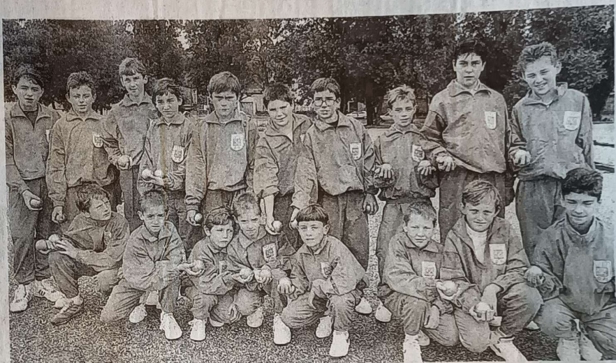
18 pétanqueurs, minimes et cadets, défendront les couleurs du Maine-et-Loire