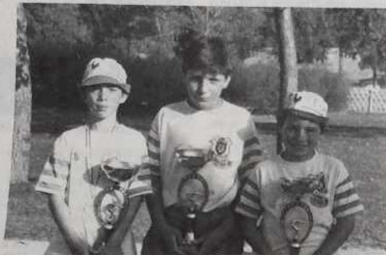
Sous-champions de France minimes.

Au jet suivant, l'avantage est aux jeunes viennois. A sa dernière boule, le milieu de l'Aisne a réussi à se faire 2 points mais il leur reste 4 boules en main première frappe qui enlève la gagne, mais ensuite 1 trou, puis un second et le point non repris. L'Aisne marque finalement 1 point. Cette équipe conclura à la mène suivante, après une double frappe, l'emportant sur le score de 13 à 11. L'Aisne est