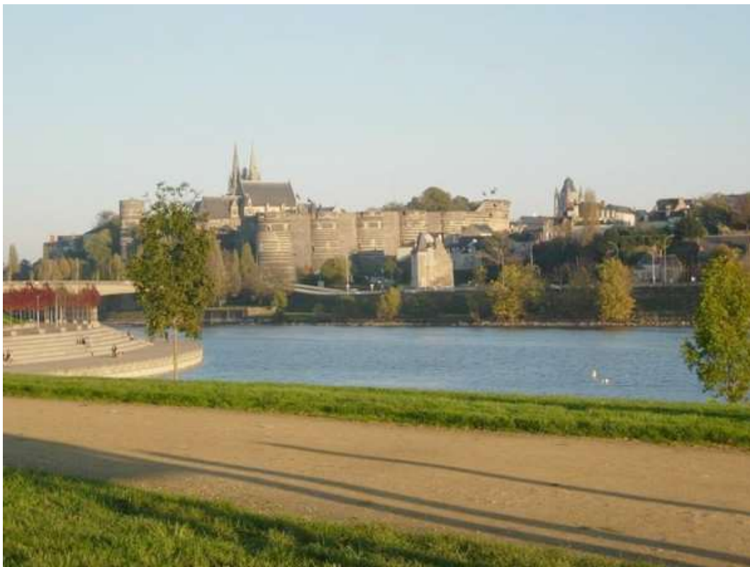
La ville d'Angers baignée par le Maine, avec en toile de fond son château et sa cathédrale

Ce Championnat de France Triplette cadet , s'est déroulé les 5 et 6 septembre 1992 à Angers (49).