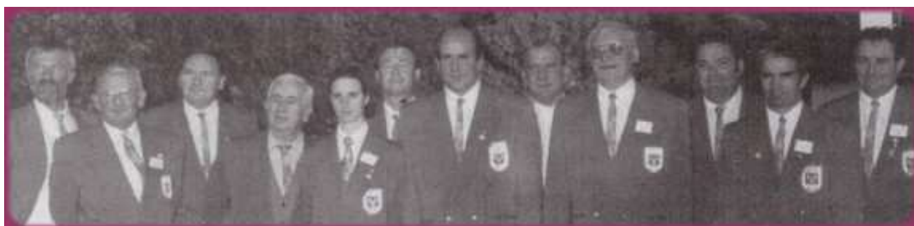
Le Comité d'Organisation du CD49 en 1992 à Angers