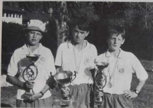
Sous-champions de France cadets.