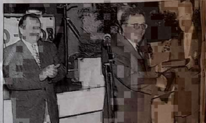
Un public nombreux et essentiellement familial