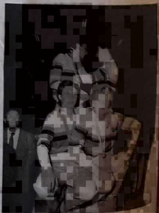
Les Français champions du monde.