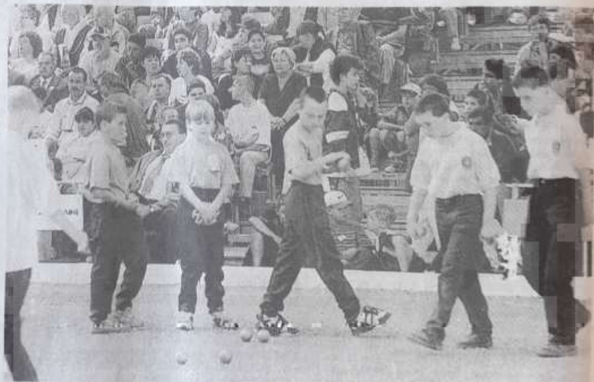
Un public nombreux, des rencontres de haut niveau, telles ont été les clefs de la réussite de ce National 1996 de Nevers.

En souhaitant que cette manifestation de niveau national prouve, une fois de plus, que la pétanque est un sport à part entière et en espérant