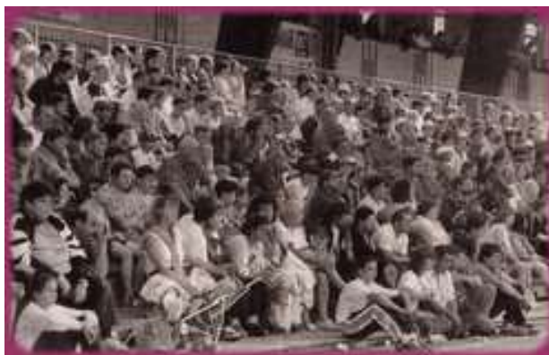
Le Centre Expositions de la Baratte, avait garni ses gradins, lors des phases finales du dimanche