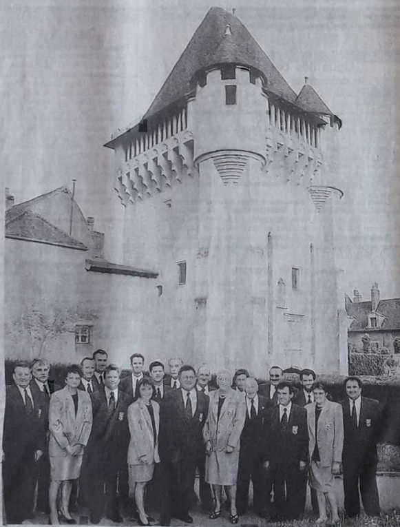
Le comité d'organisation posant, à Nevers, devant la Porte du Croux.

Les quatre départements de Bourgogne aligneront vingt et une équipes au départ de ces « France », dont dix formations nivernaises, avec la lourde charge