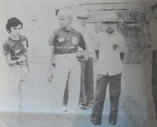
Sur le terrain, les cadets de Lunéville, ont obtenu une victoire. Insuffisant toutefois pour se qualifier