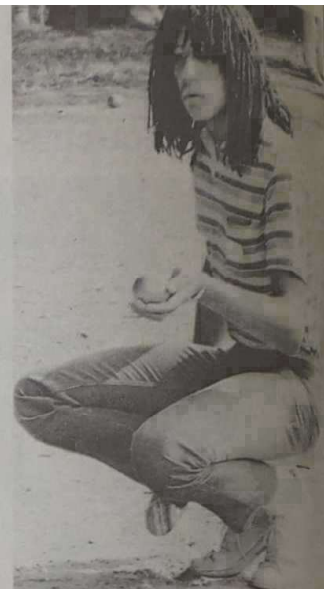
Tout le monde l'a surnommé Noah. Ce n'était qu'un nom pour les juniors de l'équipe du Haut-Rhin