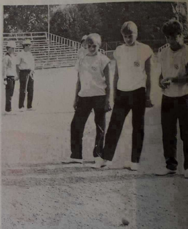
Dès leur arrivée, certains joueurs se sont immédiatement mis à l'entraînement, histoire sans doute de « tater le terrain ».

Les parties reprendront à 14 h 30, les seizièmes de finale ayant lieu à partir de 18 h. L'apéritif débutera à 19 h, salle de la livrée et sera suivi à 20 h d'un banquet en musique.