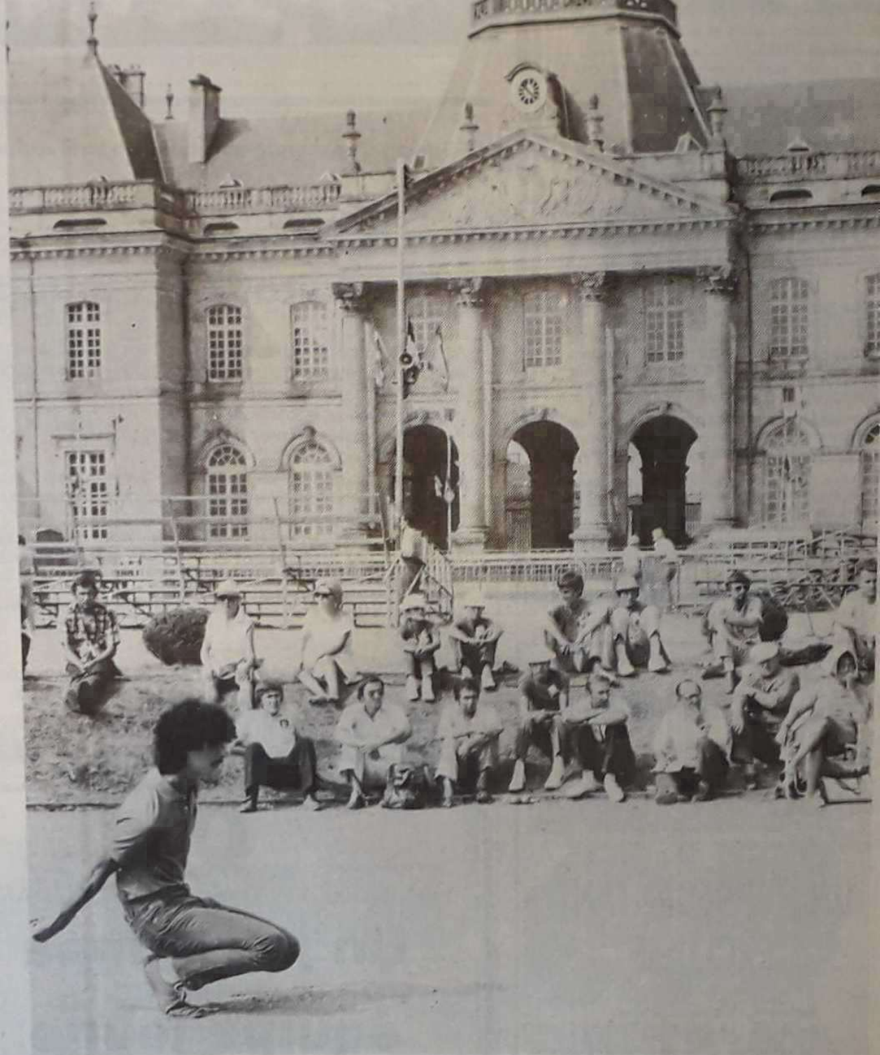
Evoluer dans un tel cadre, il y a de quoi impressionner un pointeur.