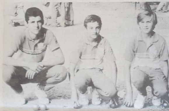
Deux défaites en éliminatoires pour les juniors de Pont-à-Mousson. L'essentiel était cependant d'être là.

Et roule le petit dans les Bosquets de Lunéville. Depuis hier matin, il en est ainsi. De la terrasse du château, au grand bassin, le coqoonnet est pointé dans les allées latérales et tous les accents se donnent libre cours. Les chapeaux sont colorés, le soleil brille : c'est merveilleux. Ainsi ont commencé les 28es championnats de France juniors en même temps que les onzièmes championnats de France cadets. C'est un super-événement : du jamais vu à Lunéville. La société locale : l'APL vit des heures de gloire, car c'est toute la cité qui se sent concernée.