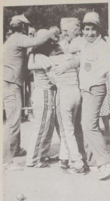
La joie des cadets de Dombasle qui viennent de se qualifier (13-12) pour les seizièmes de finale