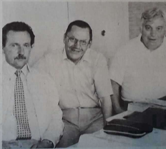
Une épreuve très populaire qui devrait attirer du monde.