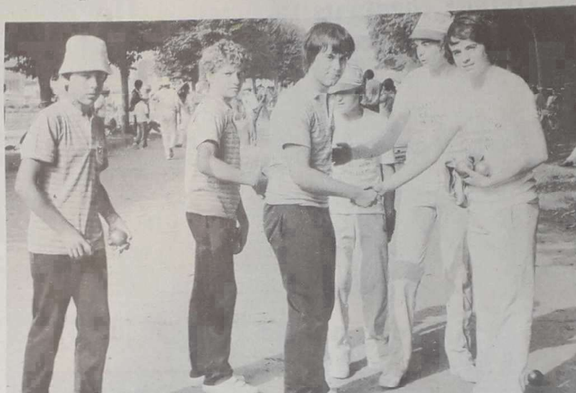
Sans rancune les juniors de Pompey (à gauche) serrent la main des Perpignais qui viennent de les éliminer