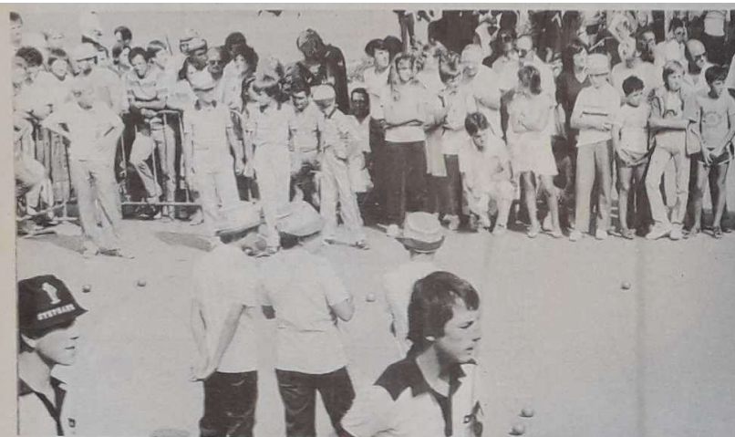
Les jeunes champions en herbe avaient attiré un nombreux public dans un cadre merveilleux