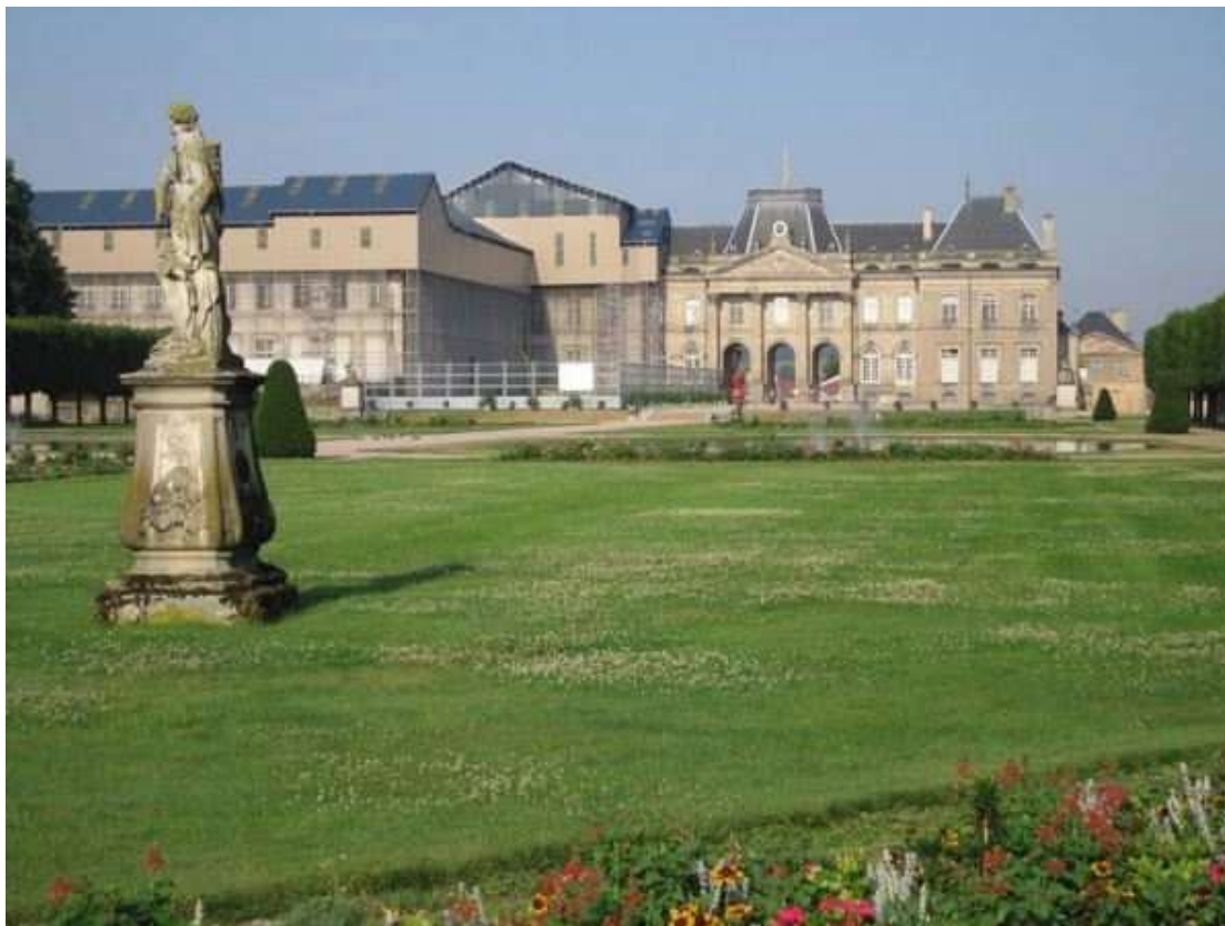
Le château de Lunéville et son Parc des Bosquets, qui ont accueilli ce Championnat de France junior en 1983

Les 27 et 28 août 1983, la ville Lorraine de Lunéville (54) a accueilli ce Championnat de France junior .