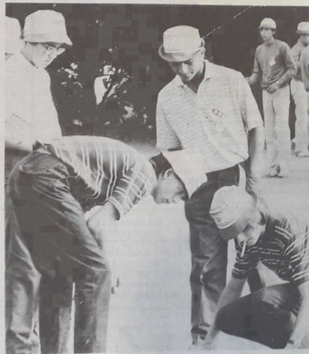
Les Lorrains ont disparu dès la première journée. Il n'en reste pas moins que certaines de leurs boules étaient si bien placées que leurs rivaux étaient obligés de mesurer sérieusement.