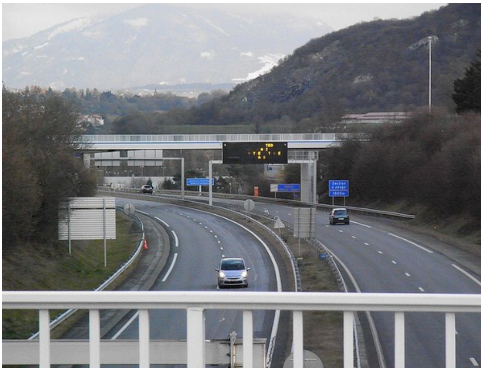
La ville de Gaillard en Haute-Savoie, a la particularité d'être coupée en 2, par l'autoroute Blanche et seuls 3 ponts permettent la communication de chaque côté de cette Bourgade

Ce Championnat de France Triplette junior , s'est déroulé les 26 et 27 août 1989 à Gaillard (74).