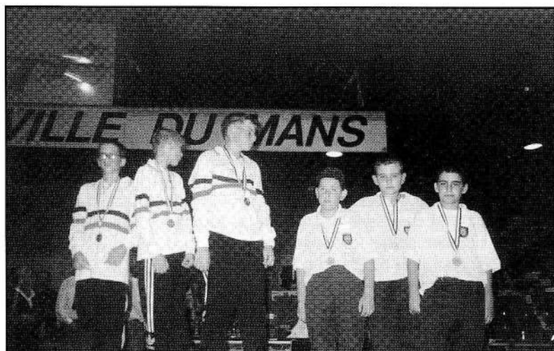
Champions et vice champions minimes