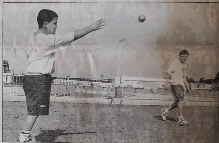
Les premiers carreaux ont été tirés hier, pour s'entraîner. Les choses sérieuses démarrent aujourd'hui dès 8 h.

□ Dimanche : de 8 h 30 à 12 h et de 14 h 30 à 17 h 30, fin des championnats et remise des récompenses à la Rotonde.