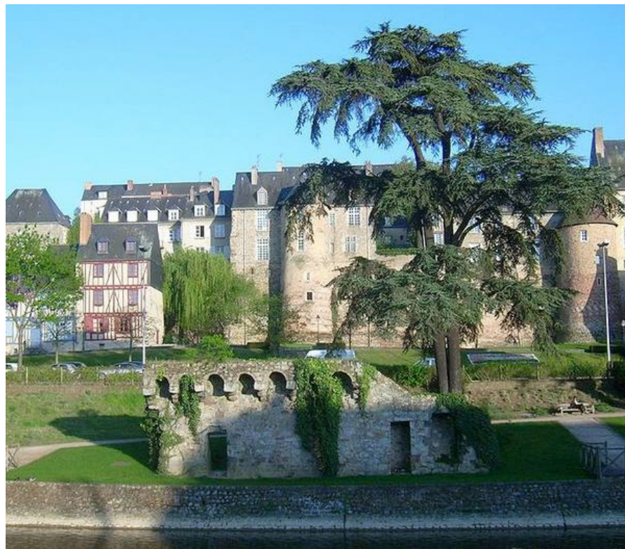
La muraille Gallo-Romaine de la cité Plantagenêt, le quartier historique du Vieux Mans

Ce Championnat de France Triplette junior , s'est déroulé les 23 et 24 août 1997 au Mans (72).