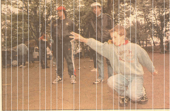
385 triplettes minimes, cadets et juniors vont en découvrant pendant 48 heures au Mans

Si il est vrai que dans le monde moderne où tout se programme et s'annonce par avance, rien n'est fait par hasard, alors ces championnats de France de Pétanque, qui nous sont offerts ce week-end au Mans, échappent-ils vraiment à la règle.