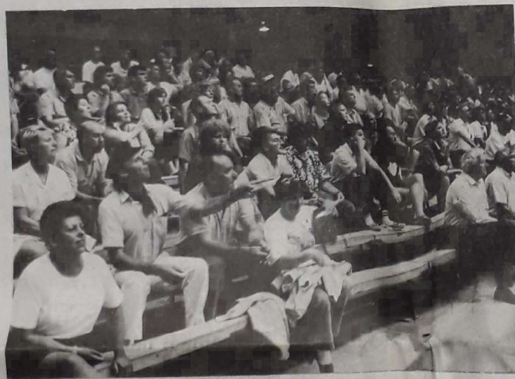
Public averti et passionné.

L es quarante-cinquième championnats de France de jeu provençal en triplette ont connu leur ultime affrontement, hier après-midi, au Parc des expositions de Toulouse en présence d'un bon public, très ouvert, si l'on en juge à ses réactions des choses de la boule.