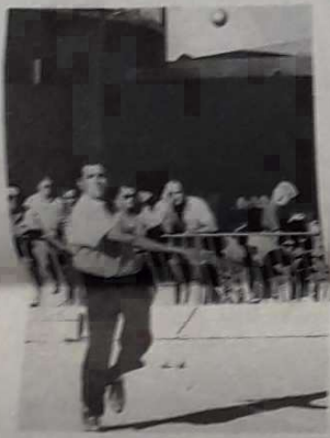
Concentré pour le tir.