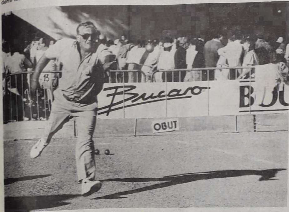
Trois pas d'élan pour un « carreau ».