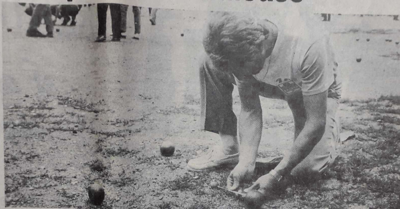
Les titres se jouent parfois à peu de chose..