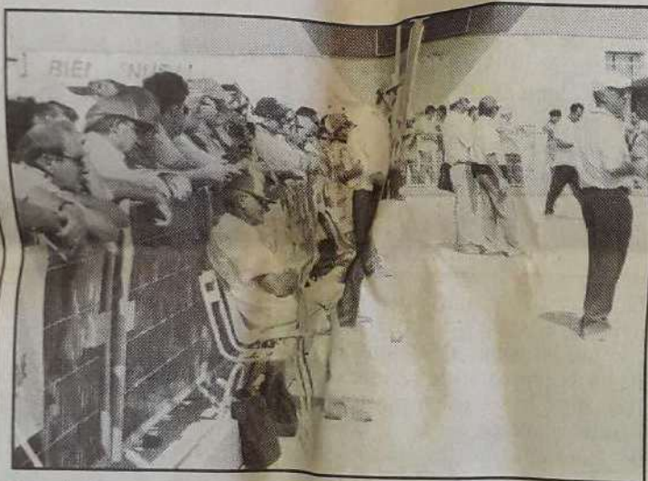
Une foule nombreuse a suivi jusqu'à la finale le déroulement des épreuves.