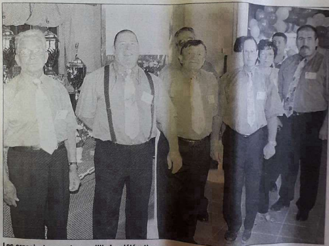
Les organisateurs ont accueillis les délégations.

10-19 heures : accueil, espace Edouard-Grégoire Le Pontet. 19 heures : ouverture officielle du