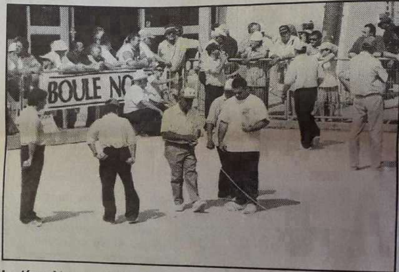
Le décamètre a parfois été bien utile pour valider la distance du cochonnet.

Pendant trois jours, notre ville a été "le centre du monde" pour les boulistes de la France entière ! Venus parfois de départements aussi peu méridionaux que l'Aisne, les Côtes d'Armor ou même Paris, accompagnés le plus souvent de leurs présidents de ligues régionales comme celles de Franche-Comté, de Languedoc-Roussillon, de Nord-Picardie ou de