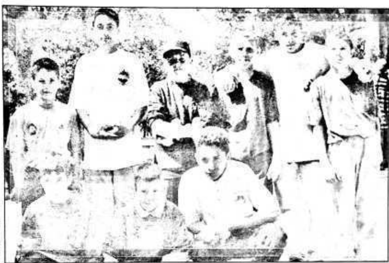
Les Cadets, à Meyrargues pour le titre du comité et la sélection à la ligue

D'autre part, nous agissons en partenariat pour rétablir, à Marseille, le très