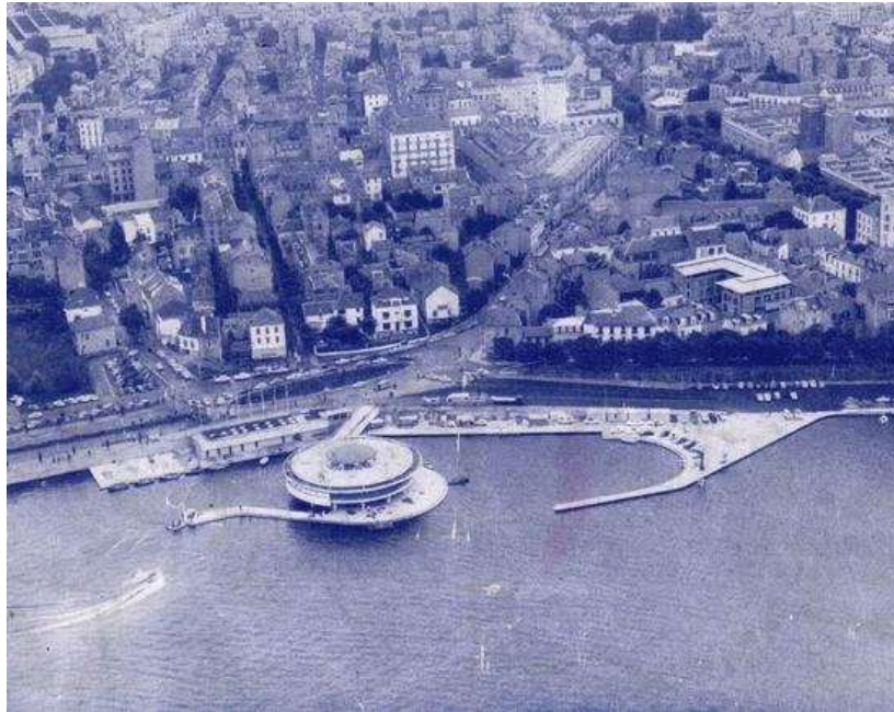
Le plan d'eau de Vichy, sur la couverture du programme de ce Championnat junior en 1966

Ce Championnat de France pétanque junior s'est déroulé à Vichy (03).