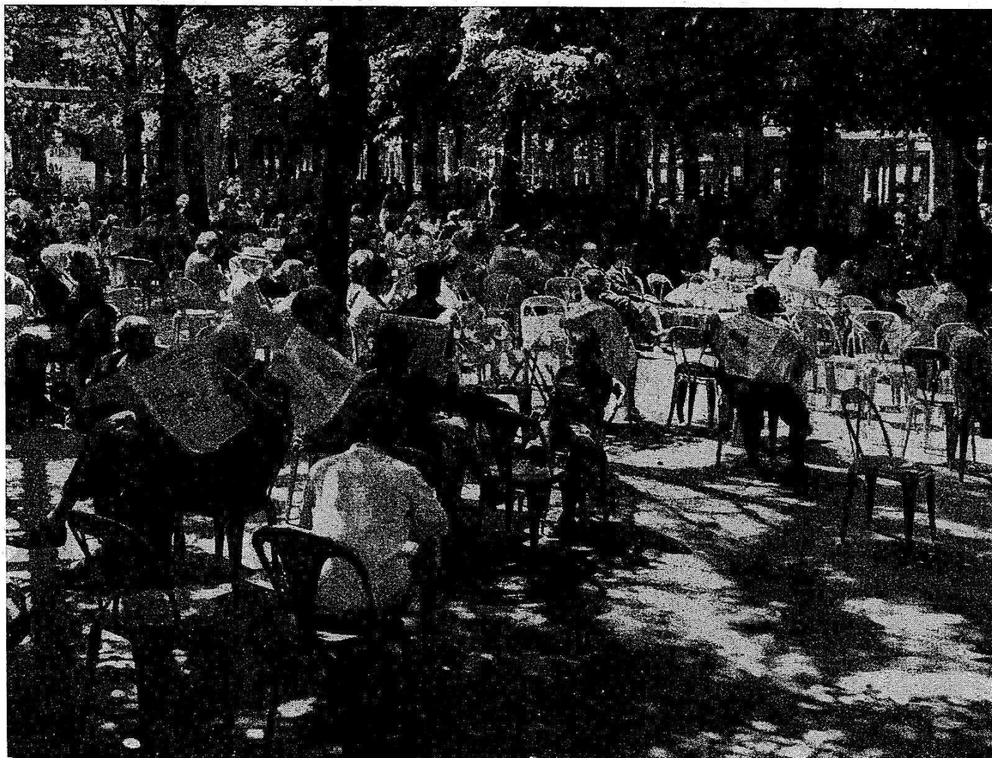
Le coin rêvé des curistes : les parcs ombragés

286 LABROUSSE Marc 287 LABROUSSE Claude 288 HAZERA Jean