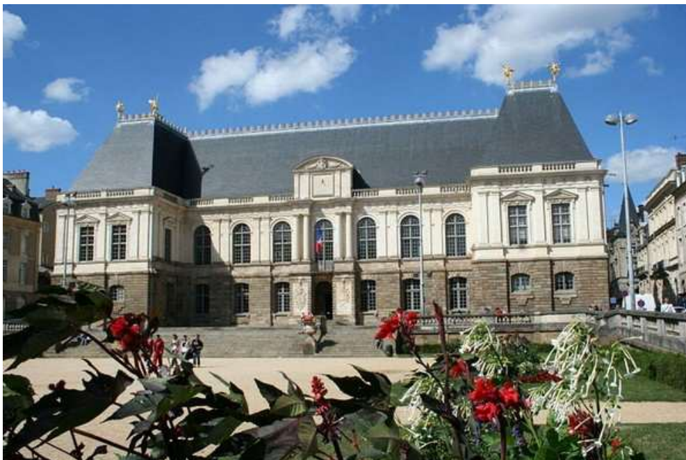
Le magnifique Palais du Parlement de Bretagne à Rennes, qui a été reconstruit suite à l'incendie de 1994

Ce Championnat de France corporatif , s'est déroulé à Rennes (35) les 18 et 19 juin 1988.