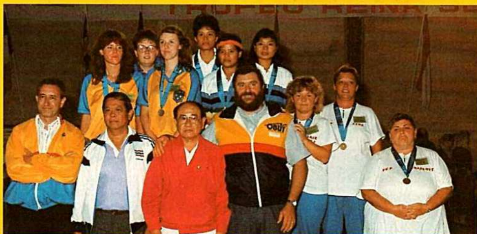
Championnes du Monde THAÏLANDE, 2 e SUÈDE, 3 e CANADA.