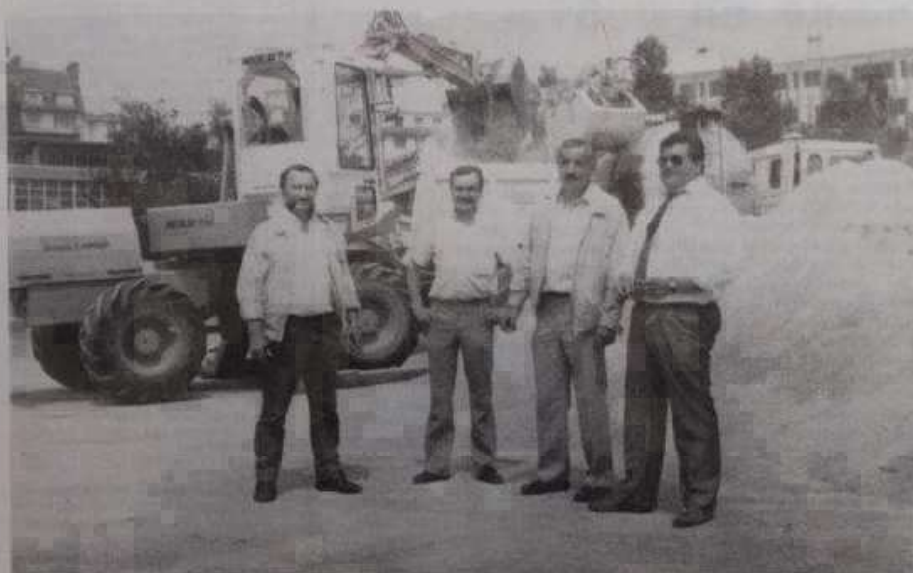
Les membres du Comité départemental de pétanque sont venus voir les travaux d'aménagement du Champ de Mars.