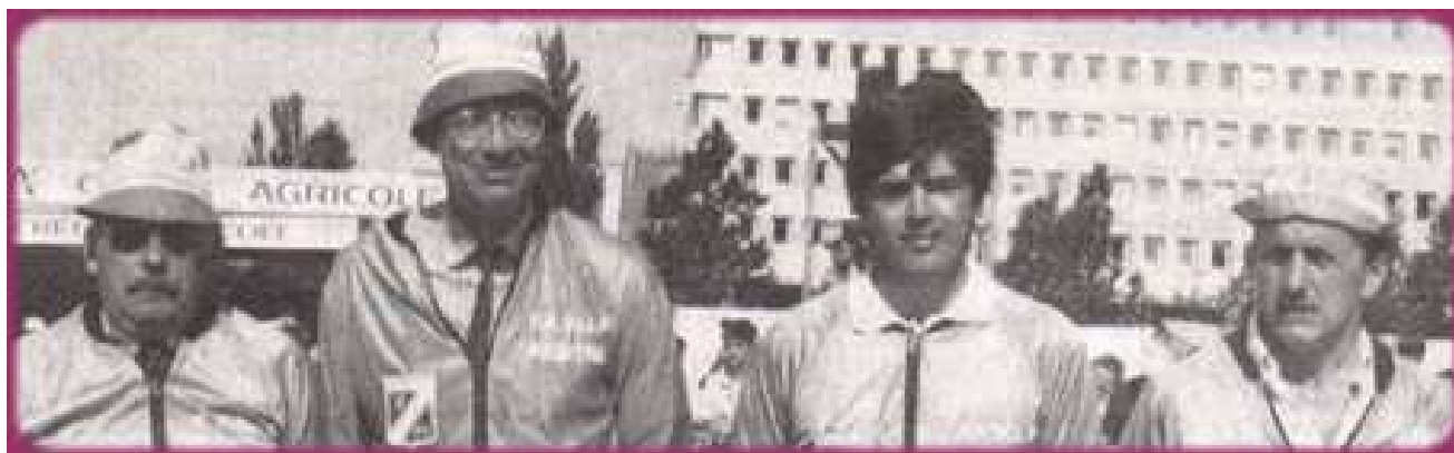
Le corps arbitral de ce Championnat corporatif à Rennes en 1988