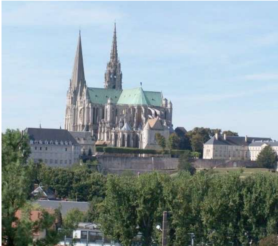
La célèbre cathédrale gothique de Notre-Dame de Chartres, inscrite au patrimoine de l'Unesco en 1979

Ce Championnat de France corporatif , s'est déroulé à Chartres (28) les 14 et 15 juin 1986.