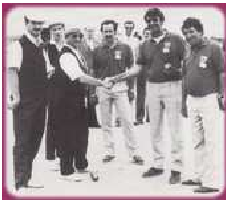
Les 2 Triplettes Finalistes de ce Championnat corporatif en 1986 à Chartres : à gauche les Champions du (17), à droite les Finalistes du (66)