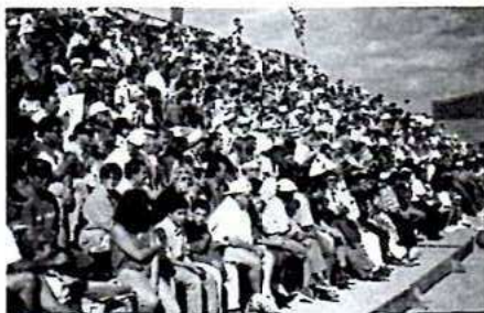
Les jeunes font recette.