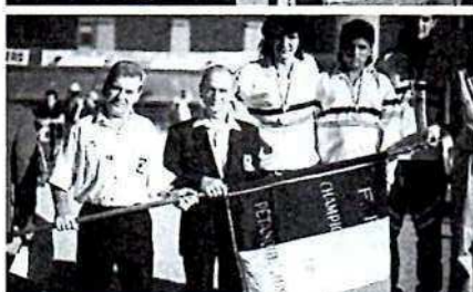
Ci-contre et de haut en bas.