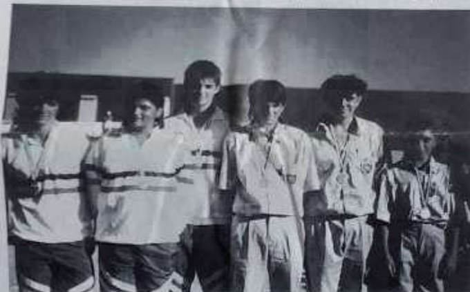
Champions et vice-champions juniors.

pouvait commencer ». Difficile ici de suivre toutes les parties, mais au fil des jeux j'ai pu voir la détresse des uns et l'assurance des autres, des déconvenues cinglantes et de vrais exploits, des minois consternés et des explosions de joie. Dans ces catégories d'âges, chaque partie est un véritable petit drame qui se joue. L'œil du coach et la présence des parents venant encore augmenter la sensibilité des participants. Témoin cette partie