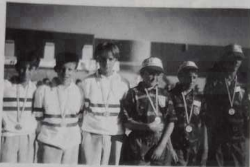
Champions et vice-champions cadets.

La partie décrite plus haute était une partie extrême. Mais il m'a été permis également au cours de ces deux journées de rencontrer des jeunes joueurs de talent et d'assister à des parties durement disputées avec une qualité de jeu tout à fait remarquable. Déjà des caractères s'affirment, des champions naissent. C'est le cas de la formation des Alpes-Maritimes qui en juniors a littéralement dominé son