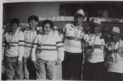
Champions et vice-champions minimes.