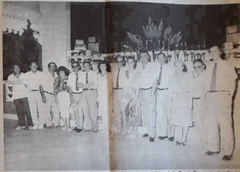
● Les officiels du Comité du Gard et les principaux membres de la Boule Beaucairoise devant coupes et challenges qui récompenseront les vainqueurs de ce 11e championnat de France, doubles, jeu provençal.