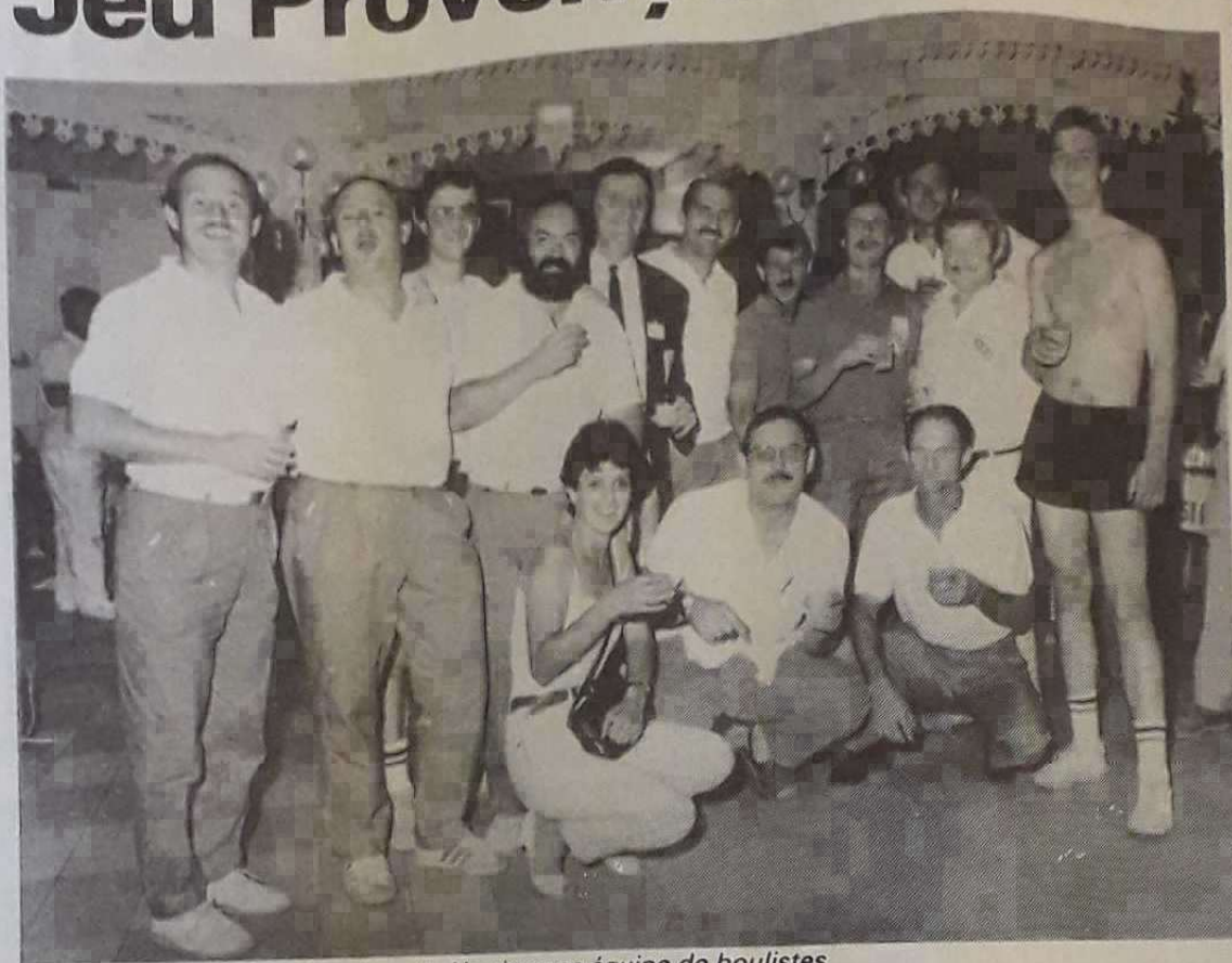
▲ Une joyeuse équipe de boulistes