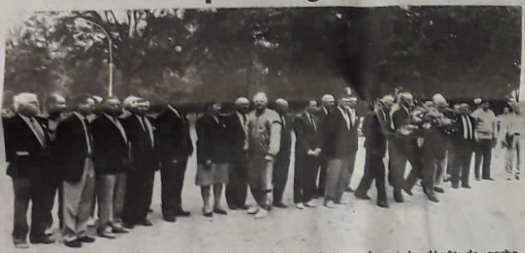
La compétition était interrompue, hier, quelques minutes, durant le dépôt de gerbe devant le monument aux morts du cours Foucault. Autour du maire de Montauban et du président de la fédération, c'est toute une foule d'amis qui participaient à cette commémoration.