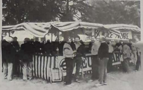
Le championnat de jeu provençal, c'est aussi un moment de détente et de fête où tout le monde se retrouve, après la compétition, devant la buvette.