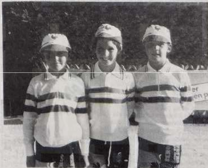
Champions de France minimes.