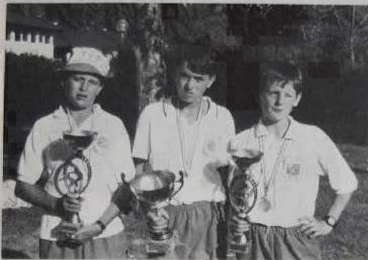
Sous-champions de France cadets.