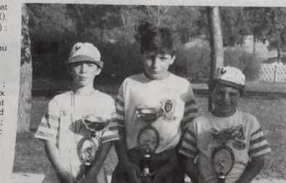
Sous-champions de France minimes.

Les joueurs du Maine-et-Loire qui ont réussi un superbe parcours, en particulier en 1/2 finale où ils ont fait carton plein, enthousiasmant le public tout acquis à leur cause, vont avoir quelques difficultés en ce début de partie. Ils craquent et les charentais prennent le large, menant 7 à 1, puis 7 à 2 et 8 à 2. Les joueurs d'Anjou se réveillent alors, d'abord en marquant 2 points, puis à la mène suivante 3, profitant d'une mauvaise