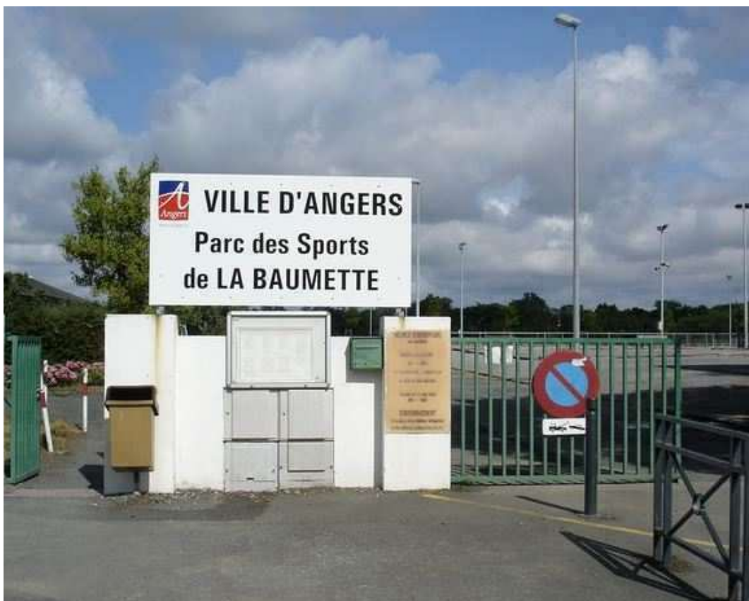
Le stade de la Baumette à Angers, un magnifique complexe sportif où s'est déroulé ce Championnat de France

Le 9 ème Championnat de France Triplette minime , s'est déroulé les 5 et 6 septembre 1992 à Angers (49).