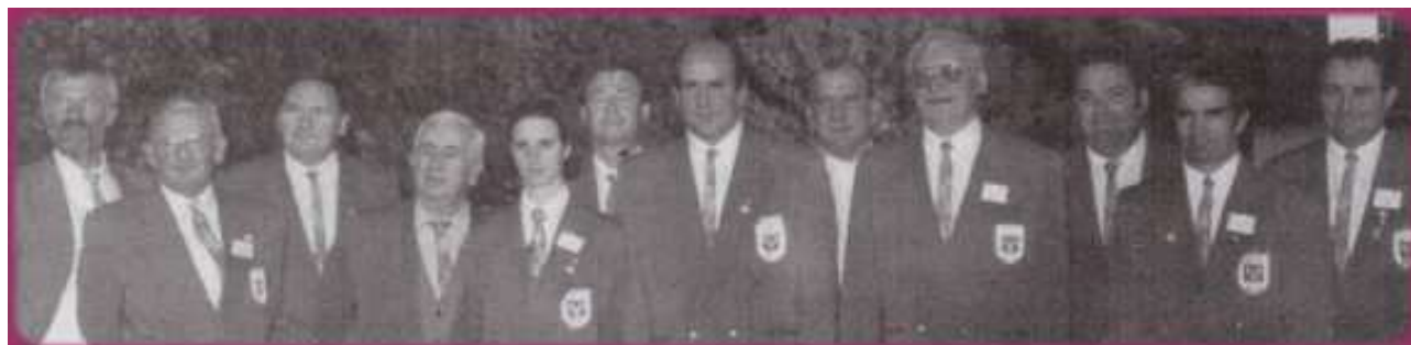
Le Comité d'Organisation du CD49 en 1992 à Angers