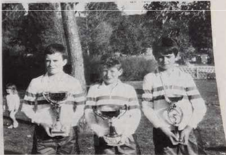
Champions de France cadets.