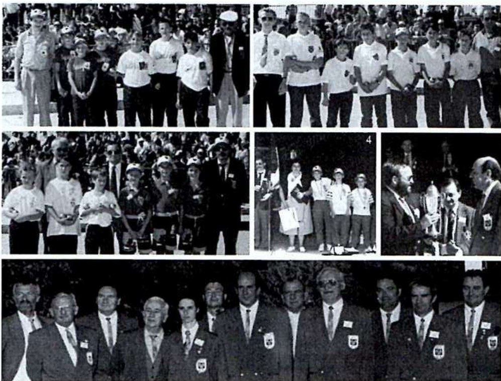
1.2.3.4. Demi-finales cadets et minimes.