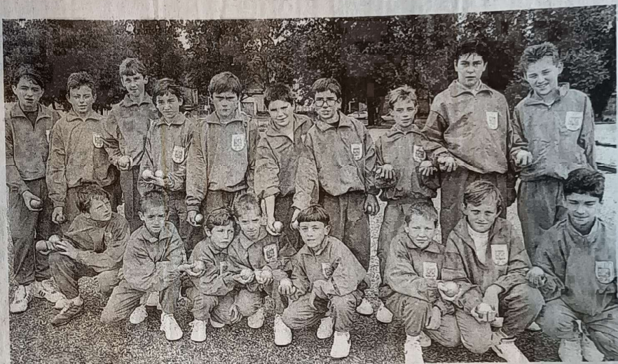
18 pétanqueurs, minimes et cadets, défendent les couleurs du Maine-et-Loire