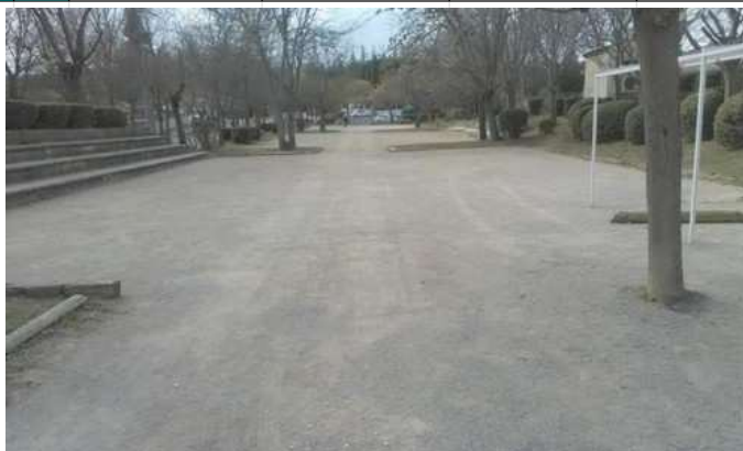
Le boulodrome actuel «La Rochette» de la Boule Manosquine (04)