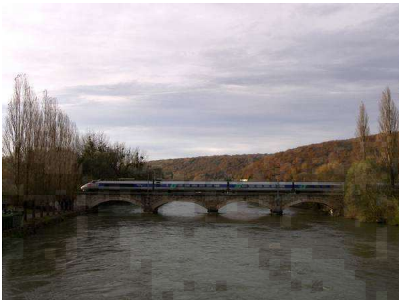
Le pont S-N-C-F de Voujeaucourt, qui permet aux TGV de traverser la rivière Doubs, pour relier Besançon à Belfort

La ville de Voujeaucourt (25) a accueilli ce Championnat de France Triplette vétéran.