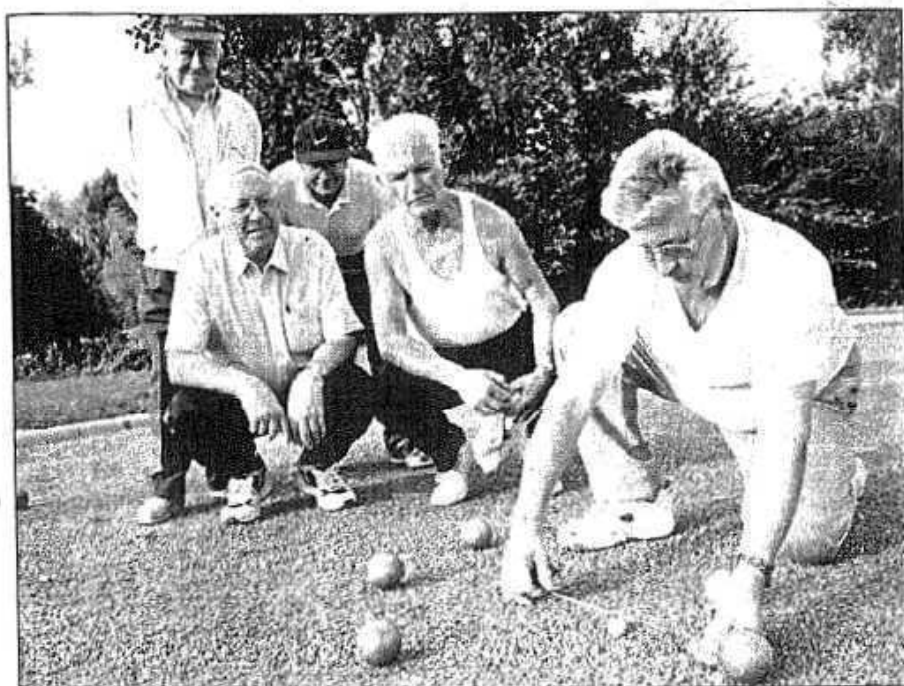
Même lors des parties d'entraînement entre l'équipe de Haute-Saône et celle de la Manche, on mesure les points avec sérieux.

Le championnat de France de pétanque vétérans en triplettes donne des accents méridionaux à l'Arcopolis Parc.