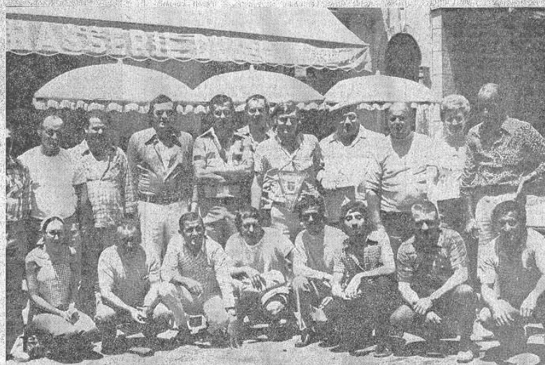
Les joueurs Bastiais et ceux d'Arena Vescovato ont rejoint leurs amis Ajacciens pour la postérité de la Boule Corse.