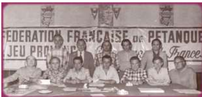
Le Comité d'Organisation Corse de ce Championnat à pétanque en 1974 à Ajaccio