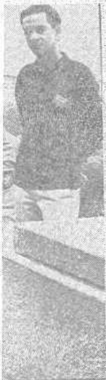
compétitions, en gauche), et de M. nota Jo Mignucci)