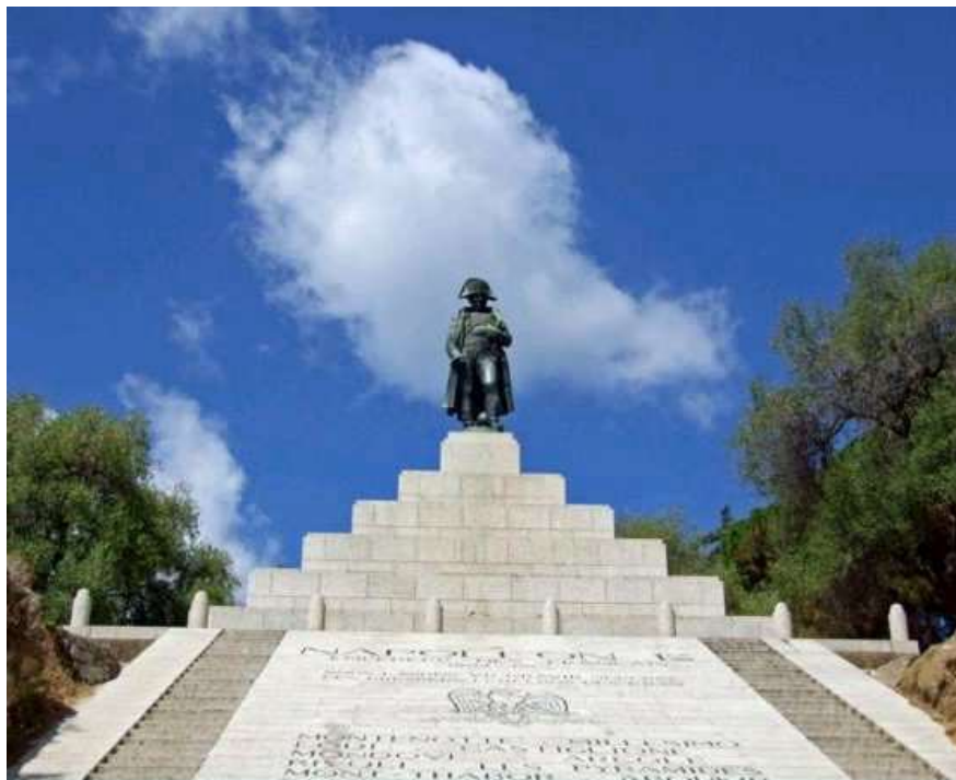
La statue de Napoléon, sur l'esplanade du Casone à Ajaccio, où se sont déroulées les phases finales de ce Championnat, le dimanche

Ce Championnat de France Triplette senior pétanque , s'est déroulé les 22 et 23 juin 1974 à Ajaccio (20).