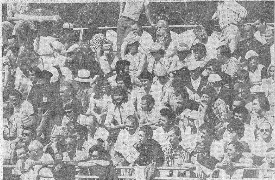
Une foule très importante suit les rencontres.