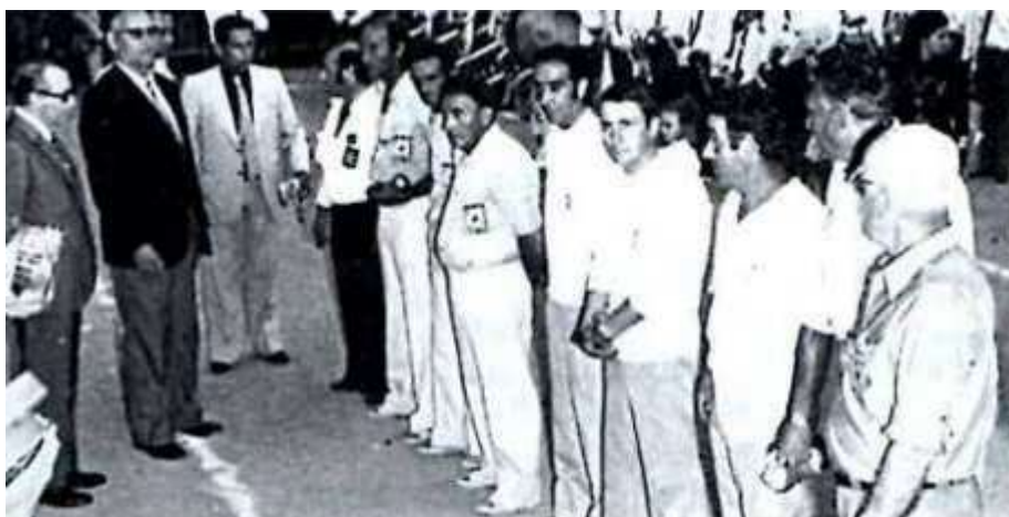
Présentation des 2 Triplettes Finalistes de ce Championnat de France à Ajaccio en 1974