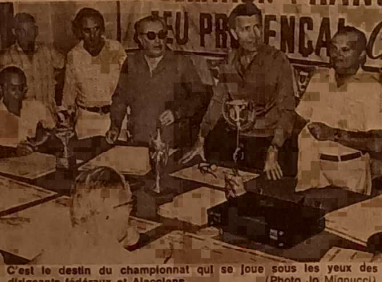
C'est le destin du championnat qui se joue sous les yeux des dirigeants fédéraux et Ajacciens.

Les triplés ajacciens ont fait une brève apparition au P.C. pour connaître leurs futurs adversaires. Réactions mitigées mais dans l'ensemble favorables.