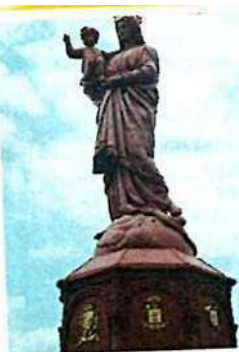
Notre-Dame du Puy