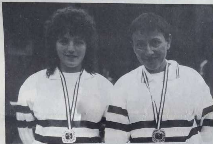
Les championnes de France arborant leurs nouveaux maillots et les médailles d'or de la F.F.P.J.P.