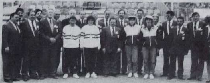
Les finalistes et le comité.