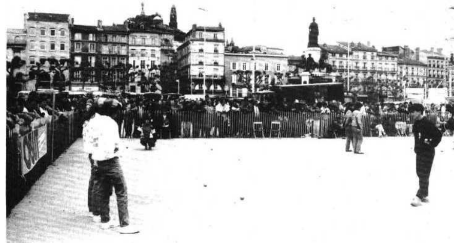
Vue générale de la place du Breuil.

● HUMOUR... QUAND TU NOUS TIENS !! Entendu, sous forme de devinette, dans un groupe de personnes apparemment sérieuses : - Quel est le plus beau rêve d'une boule de pétanque ? - L'amour des suceons... et la vie à la colle avec le but. Un rêve... cochonnet !!