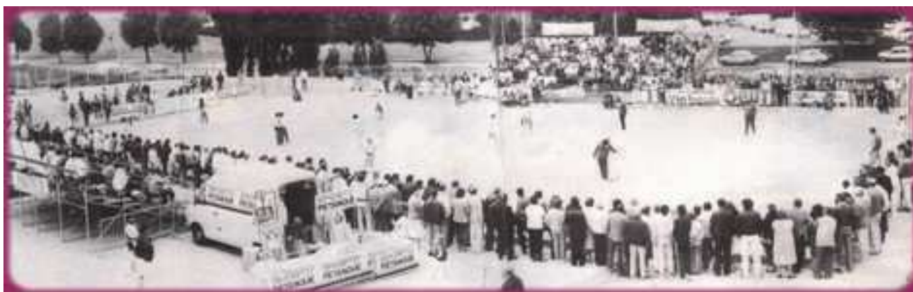
Une vue générale des terrains d'honneur de ce Championnat féminin à Créteil en 1986