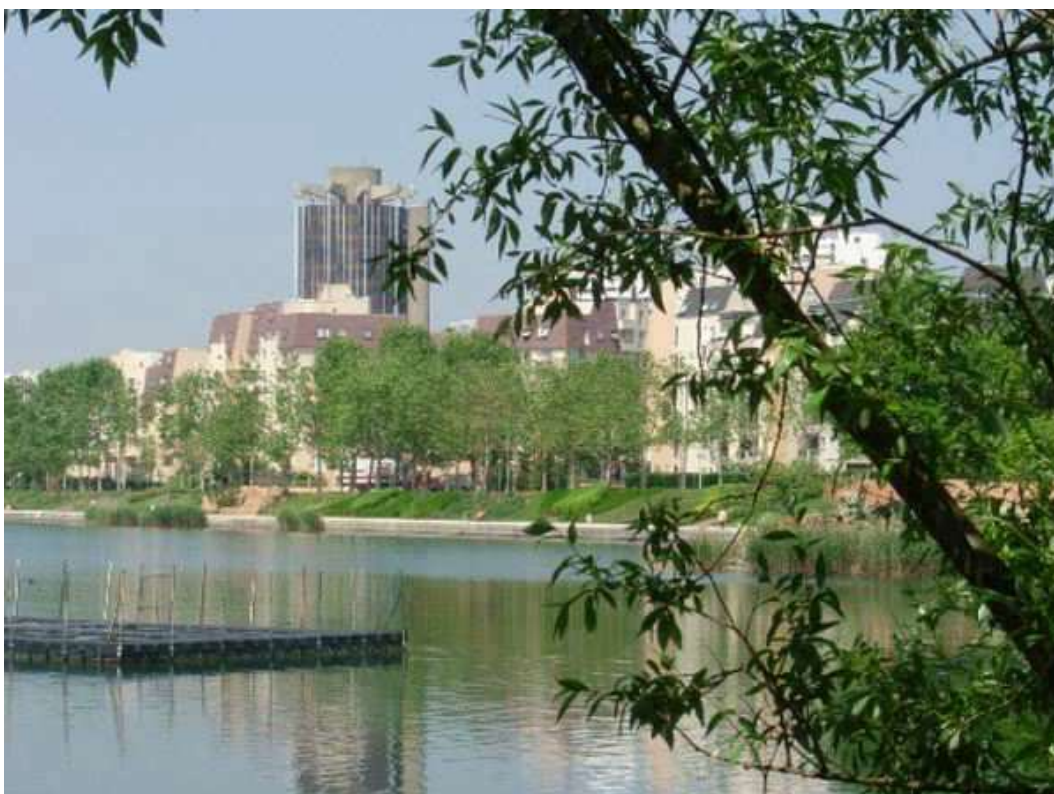
Le lac de Créteil, attenant au Parc de Loisirs, où s'est déroulé ce Championnat féminin

C'est la ville de Créteil dans le Val-de-Marne, qui a été l'hôte de ce Championnat de France féminin pétanque.