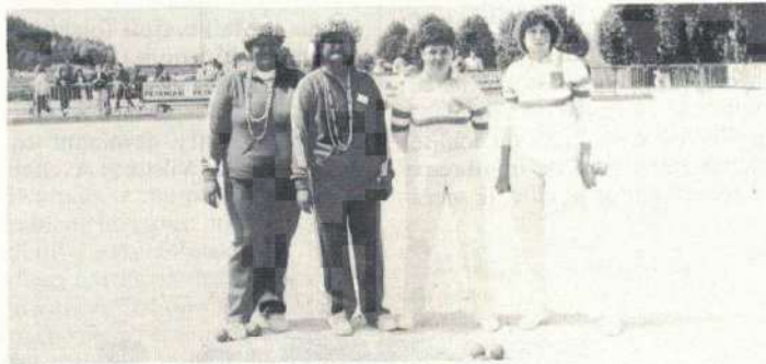
L'équipe de Polynésie et les championnes sortantes

• Les championnes en titre sont opposées à Sarda-Coros de l'Hérault, championne de la ligue Languedoc-Roussillon. Une partie dont on attend beaucoup tant la prestation des deux équipes avait été excellente au cours des tours précédents. Malheureusement l'équipe Seine-et-Marnaise d'emblée ne trouvera pas son rythme et les joueuses de l'Hérault prirent rapidement un