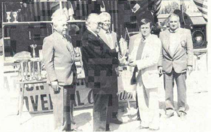
Le passage du flambeau

avantage décisif qui se solda par une victoire 13 à 4. Il reste à féliciter Carbillet et Rodriguez qui en se trouvant une nouvelle fois en demi-finale confirment leur valeur.