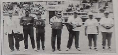
La finale de la coupe des Dom-Tom trouva son épilogue au terme de 11 menés

En finale, dimanche dans les arènes de Soustons, la Polynésie française représentée par Tahiti a été défaite par l'équipe de la Martinique