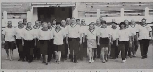
Organisation d'expérience pour le comité directeur landais qui organise un quatrième championnat de France

Honneur aux dames ce week-end à Soustons où les femmes règneront sans partage sur le bouledrome avant de briguer dans les arènes le titre de championnes de France.