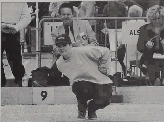
« La réflexion évite les mauvais réflexes »

Estomac. — Il est primordial de prendre un bon petit-déjeuner et de prévoir une collation, se conten-