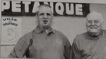
« Nous apportons notre quote-part à ce championnat de France de féminines en doublettes »

La participation du club à l'événement commençait dès le début de l'année avec la recherche d'annonceurs indispensables à l'édition de la plaquette. Aucun des neuf membres du bureau du club ne se trouvait exempté du démarchage. « Les résultats ont dépassé nos espérances. Nous avons reçu un ac-