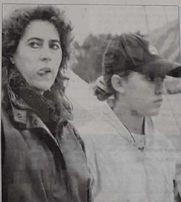
L'équipe de Saint-Sever