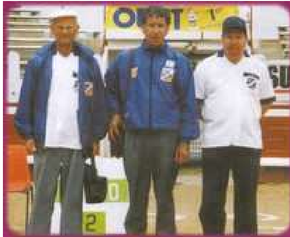
Les arbitres qui ont officié lors de ce Championnat de France féminin, à Soustons en 2001