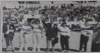
Les finalistes saluant après la compétition