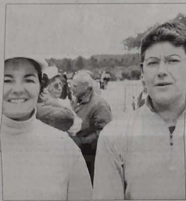
L'équipe de Hossegor

Cette doublette ne fera sûrement pas la même erreur que l'année dernière. Elle a déjà déçu après avoir disposé des championnes sortantes. Expérience acquise, le titre n'est pas utopique pour ces Landaises.