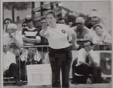
Les féminines représentent 14 % des effectifs licenciés en France, et 18 % dans les Landes