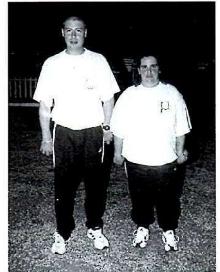
L'autre équipe demi-finaliste.