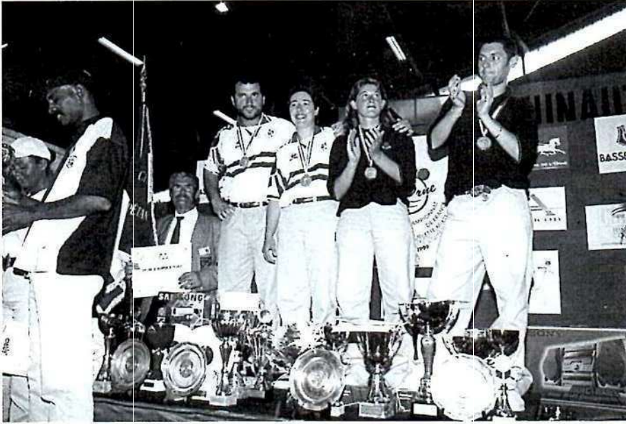
Champions et vice-champions du même club!