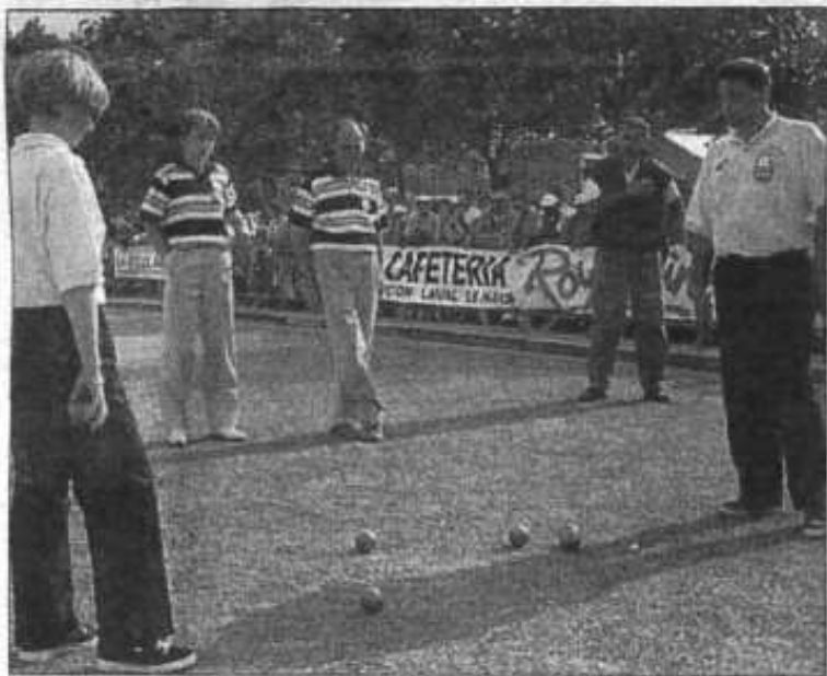
À la conquête d'un titre national, cela demande un maximum de concentration.