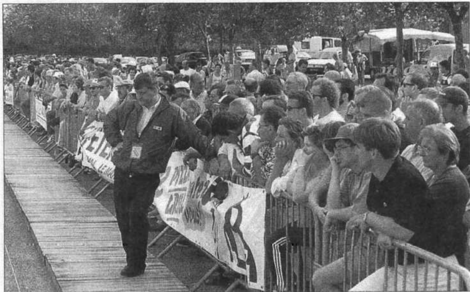
Plusieurs centaines de passionnés de pétanque ont suivi les parties du championnat de France de doublette mixte, samedi et dimanche au parc Élan.

Le championnat de France de pétanque en doublette mixte a réuni un très nombreux public, ce week-end au parc Élan. Samedi, 127 équipes ont disputé les poules qualificatives qui se sont achevées, dimanche, dans le carré d'honneur aménagé dans le hall principal.